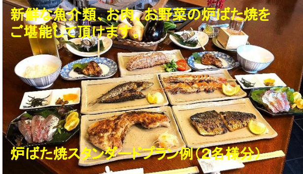
新鮮な魚介類、お肉、お野菜の焼ばた焼をご堪能頂けます

当館は客室4部屋の小さな純和風旅館ですが、ペット(5kg以下超小型犬)がいても、いなくてもより一層楽しい旅の思い出になるようなおもてなしをご用意しておりますので是非お越し下さいませ