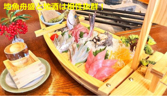
地魚舟盛と地酒は相性抜群!

厳選されたお勧め地ビールや地酒 そして最近注目の防腐剤無添加の 自然派ワイン等が居酒屋価格! これしさ倍増です!!