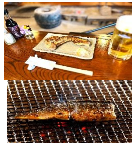
炭火で焼き上げる熱々焼ばた焼を目の前で楽しみください