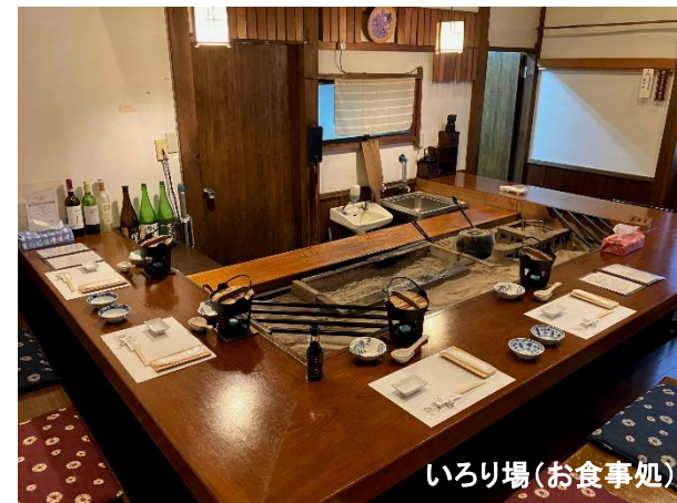
いろいろ場(お食事処)