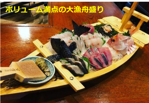
ポリューム満点の大漁舟盛り